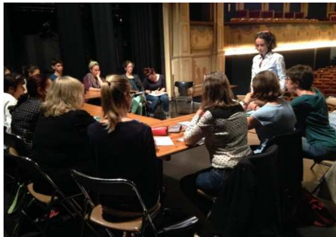
Le Comité de lecture réuni sur le plateau du Théâtre de Vienne, le 16/09/2015

Vendredi 27 mai - 20h45 : 97 / 55 participants