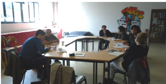
Rencontre avec les habitants témoins d'une traversée, au Centre social Vallée de Gère le 7/10/2015

Public : Ados / Adultes à partir de 12 ans